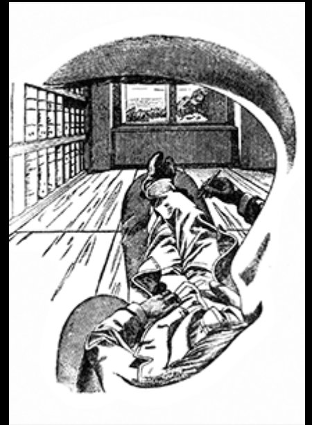
Ernst Mach, Selbstanschauung , 1886, Holzstich