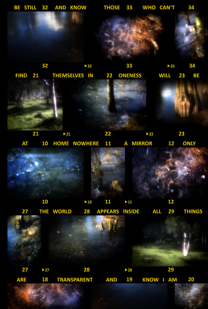
Be Still , 2017, Fotoabzug hinter Acryl, 70 cm x 100 cm

Die Arbeit Be Still , eine Bild-Text-Collage, die aus einer Reihe von Fotografien besteht, die mithilfe einer Zonenplatte aufgenommen wurden, thematisiert das Innen und Außen unserer Wahrnehmung. Gemäß unserer Alltagserfahrung betrachten wir die Welt aus unserem Inneren heraus als etwas, das sich außerhalb unseres Selbst befindet. Aber ist das wirklich so? - Unschärfen und das durch die Zonenplatte erzeugte, verschleierte Leuchten sollen die Objektivität der fotografischen Technik und unserer Wahrnehmung in Frage stellen. Ähnlich dem Holzstich Selbstanschauung von Ernst Mach, auch bekannt als Blick aus dem linken Auge , bei dem Nase und Augenhöhle an den Bildrändern erkennbar sind, soll der Betrachter hier durch teilweise starke Vignettierungen an seine Betrachterrolle bei der Konstruktion von Wirklichkeit erinnert werden.